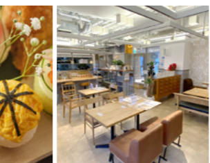
ゆったりくつろげる店内