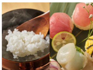
注文後に銅羽釜で炊くご飯と、つくも手毬

日本の食事の素晴らしさを改めて実感。特別な日、普段の生活、それぞれに合うメニューが揃う。ご飯の香り高さは、長時間給水させた白米を、注文の後に銅羽釜で炊き上げるから。看板メニュー、つくも手毬(まり)は那智勝浦直送のマグロや季節のネタを味わえる。気軽なカフェ使いもできてうれしい。