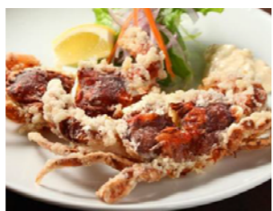
名物ソフトシェルクラブの姿揚げ