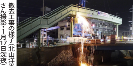
撤去工事の様子1月17日深夜

渋滞解消がねらいで、撤去したスペースなどを利用し、右折専用レーンや横断歩道などが設置される予定だ。