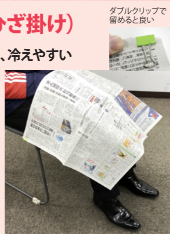
ダブルクリップで留めると良い