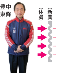
熱伝導率が悪い空気を含む新聞紙は体温を逃がしにくい