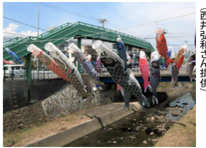
天竺川の上を泳ぐ鯉のぼり

八坂横断歩道橋は、その姿を変えてもなお、地域の子どもの健やかな成長を願いつける。